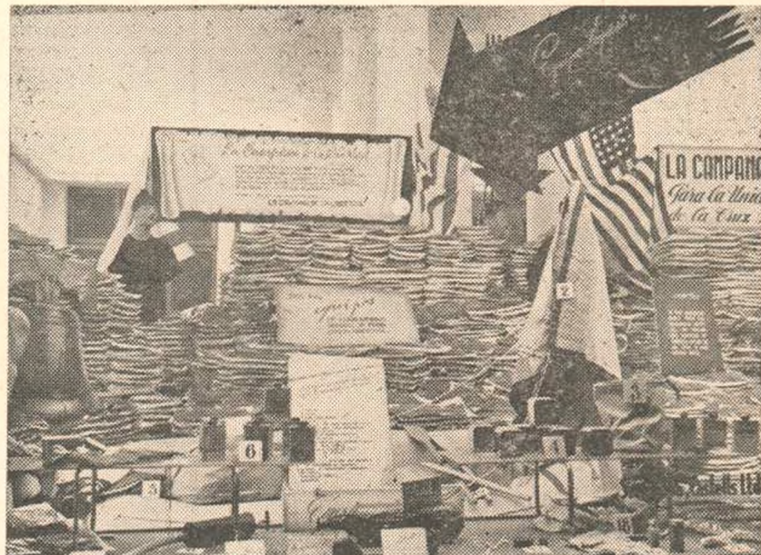
Muestras gráficas de la exposición de los 2.000 equipos confeccionados para la Unidad Estadounidense de la Cruz Roja Uruguaya y "Equipo Tropical" de paracaidistas de las fuerzas aéreas de los EE. UU., realizada recientemente en las vidrieras de la firma Serratos y Castells Ltda.

Institución. Por razones lógicas, sólo se hará una exposición a grandes rasgos de todo lo actuado durante su mandato, dejando a los señores afiliados el juzgamiento de la forma en que ha sido cumplida la labor encomendada.