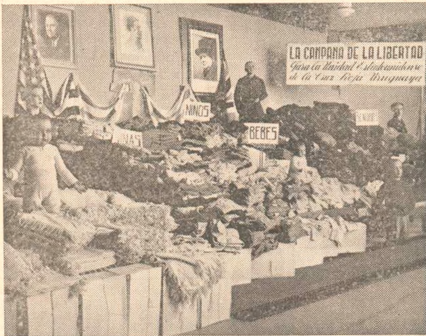
Un aspecto de la exhibición privada realizada en "London-París"

Es bueno advertir, que según la costumbre y de acuerdo con nuestros Estatutos, que imponen imperativamente la obligación de invertir en productos del país los fondos recaudados, las ropas embarcadas en nombre de nuestros asociados, fueron confeccionadas con productos genuinamente nacionales.