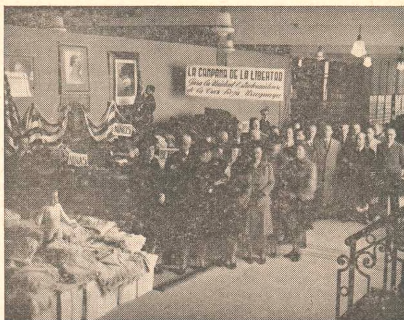
Concurrentes a la exhibición privada realizada en "London-París"